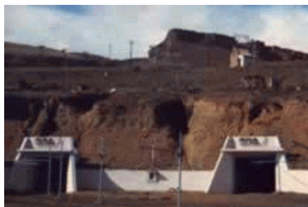
Vista de entrada de dos minas

La extracción en la Mina 2 fue iniciada a mediados de 1947, con el comienzo de su galería principal, en la parte baja del Manto Superior. En 1950 esa galería alcanzó los 650 metros; no habiéndose logrado aún la mecanización de las labores mineras.