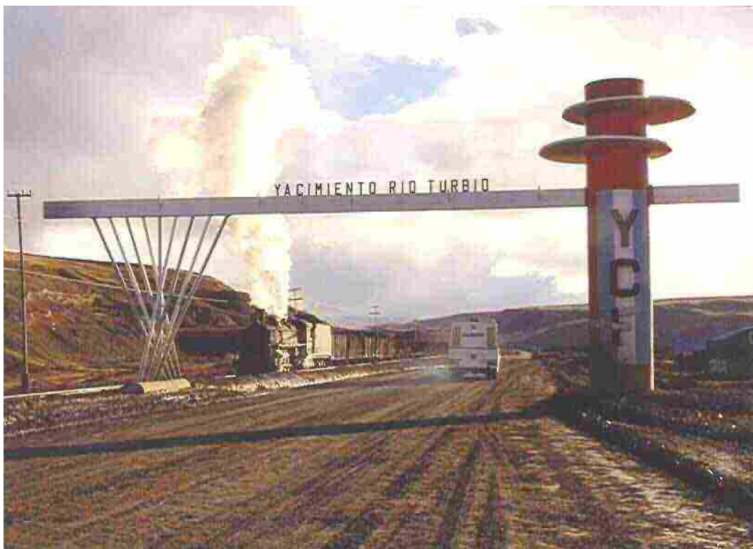
Yacimiento Río Turbio

Durante la crisis de combustible provocada por la segunda guerra mundial, este yacimiento llegó a ser explotado de manera parcial, con el nombre “Mina La Criolla”.