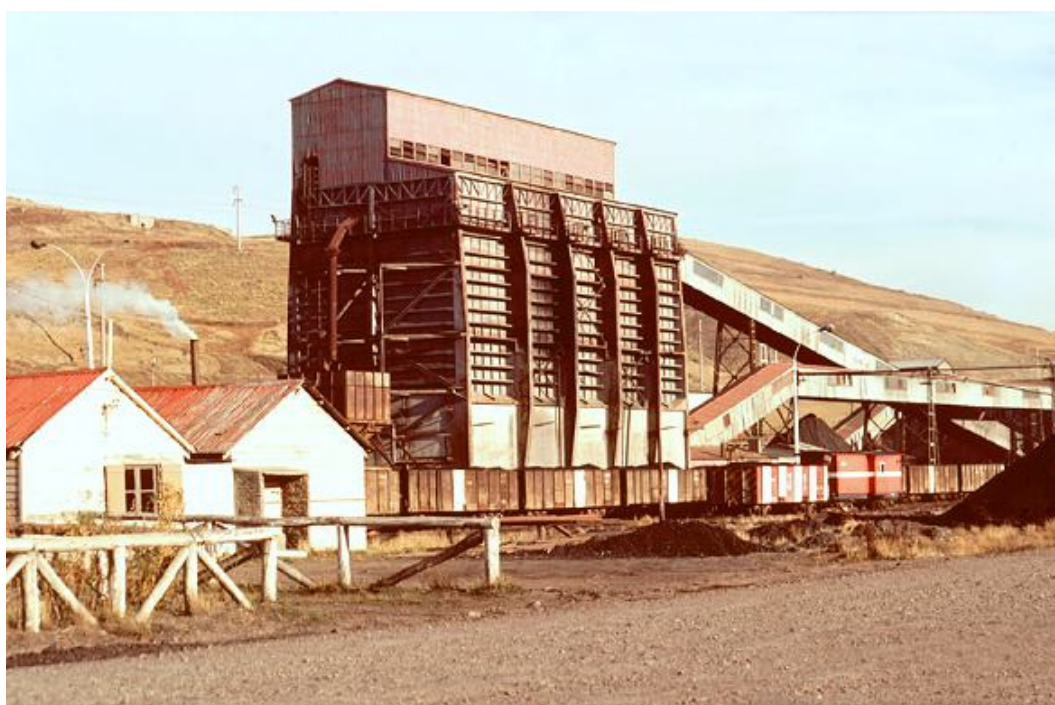
Depósitos de carbón

En la década del 70, el mundo se inicia bajo el signo del carbón. La tarea de Yacimientos Carboníferos Fiscales representa una alta responsabilidad respecto a la política de abastecimiento y previsiones, que la arraigan en el proceso y desarrollo del país.