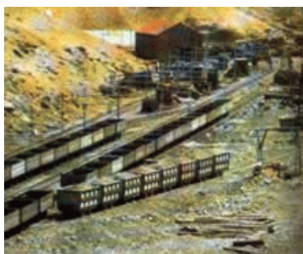
Trenes que transportan el carbón

Se dispuso de una mayor cantidad de compresores eléctricos y luego se instalaron canales oscilantes para el transporte de carbón en los frentes de extracción, cintas transportadoras de gran caudal de aire, guinchos y bombas eléctricas.