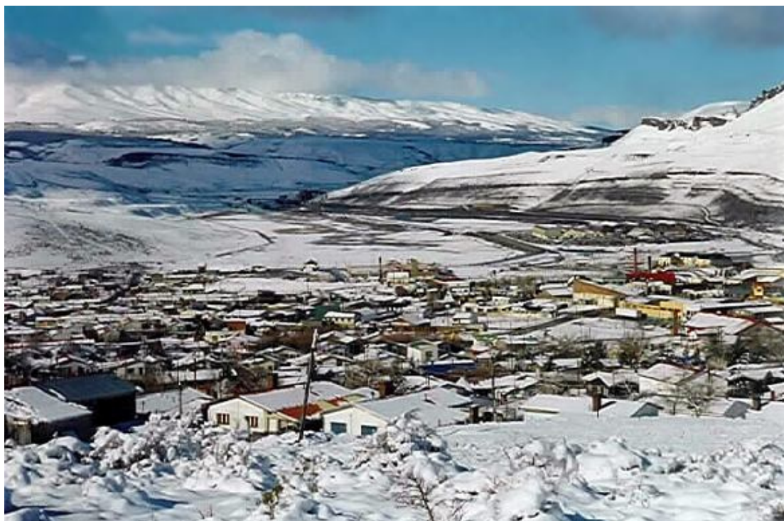
Imagen de Río Turbio

La Región de Río Turbio conforma la cobertura del yacimiento carbonífero más rico de la República Argentina.